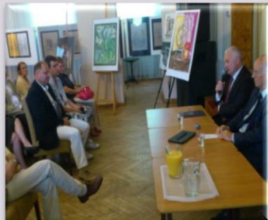
Spotkanie pt., "Sprawy Wielunia i okolic" w Wieluniu