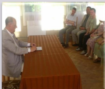
Spotkanie z mieszkańcami Szadku