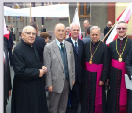
Marsz w obronie Telewizji Trwam w Zduńskiej Woli