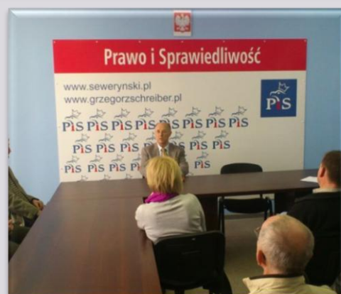
Spotkanie z członkami i sympatykami PIS w Sieradzu