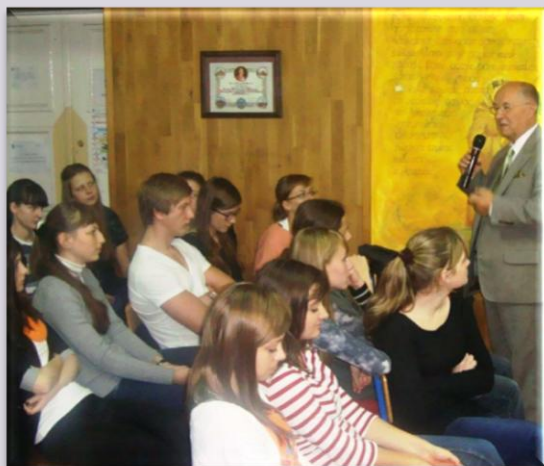
Wizyta w Liceum Katolickim w Wieluniu