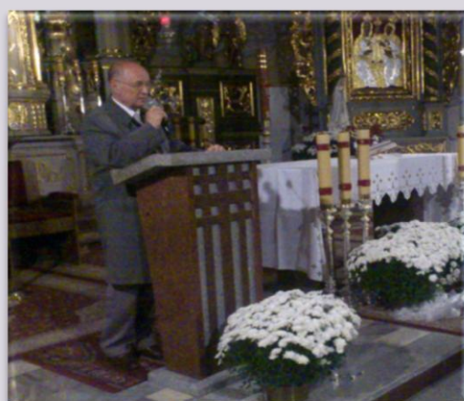
Spotkanie pt. „Problemy wychowania w polskiej szkole” w Kościele Wszystkich Świętych w Sieradzu