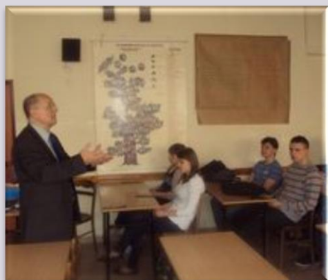
Lekcja WOS-u w II Liceum Ogólnokształcącym im. Stefana Żeromskiego w Sieradzu