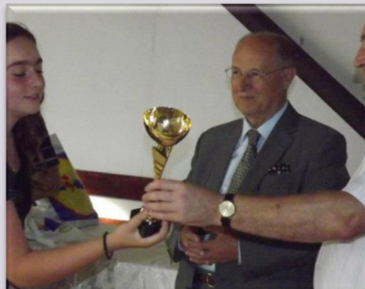
Rozdanie nagród w turnieju tenisa stołowego i szachach w Kamionaczu