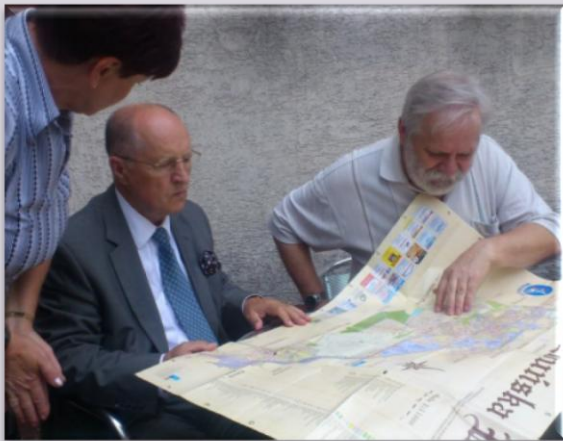
Spotkanie z przedstawicielami Stowarzyszenia Wierchlas Osiedla Karsznice Zduńska Wola